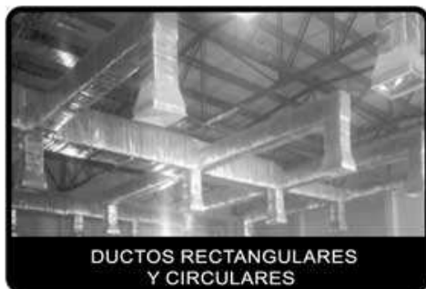
DUCTOS RECTANGULARES Y CIRCULARES