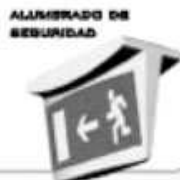
ALUMBRADO DE SEGURIDAD