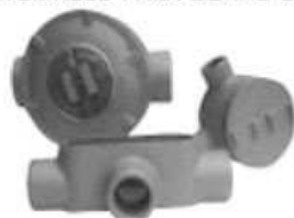
CAJAS DE PASE

MATERIALES PARA ZONAS CON RIESGO DE EXPLOSIÓN