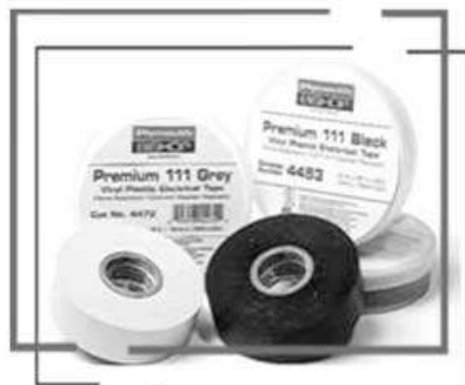
Fig. 1 Cintas aislantes

Cinta diseñada para todo tipo de condiciones atmosféricas, usada como aislante y como cubierta. Tiene mejores propiedades eléctricas y mecánicas que las cintas dieléctricas similares, además de tener una fuerza adhesiva, es delgada y a la vez resistente. Fácilmente aplicada para bajas temperaturas y para no más de 600 voltios.