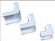
ACCESORIOS PARA CANALETA