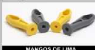
MANGOS DE LIMA