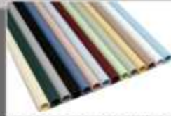
TUBOS TOALLEROS RAYADOS