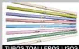
TUBOS TOALLEROS LISOS