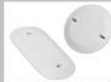
TARAS CIEGAS OVALADAS Y CIRCULARES