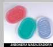
JABONERA MASAJEADORA FLEX