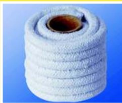
CORDON DE FIBRA CERAMICA