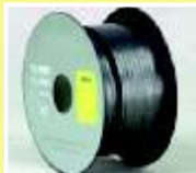
BASE DE GRAFITO