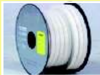
CON BASE DE RAMIO