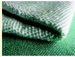
TELA DE FIBRA DE VIDRIO