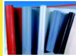
TELA DE FIBRA DE VIDRIO SILICONADA