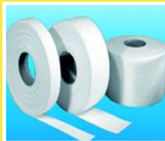
CINTA DE FIBRA CERAMICA