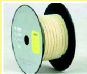
BASE DE KEVLAR (ARAMIDA)