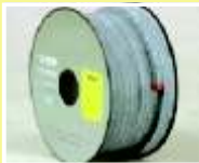
CON BASE DE FIBRA DE CARBON