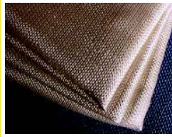
TELA DE FIBRA DE VIDRIO TEXTURIZADA CON TRATAMIENTO TERMICO