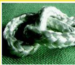
CORDON DE FIBRA DE VIDRIO