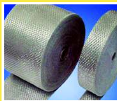
CINTA DE FIBRA DE VIDRIO