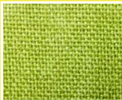
TELA DE FIBRA CERAMICA CON VERMICULITE