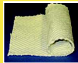
TELA DE FIBRA CERAMICA