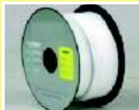
CON BASE DE TEFLON