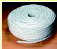
CON BASE DE ASBESTO