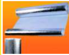
TELA DE FIBRA DE VIDRIO ALUMINIZADA